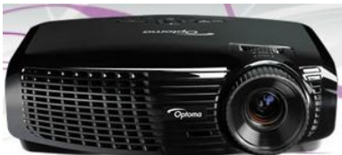
IMAGEN Y SONIDO:

-TELEVISORES, ALTAVOCES, SOPORTES, PROYECTORES