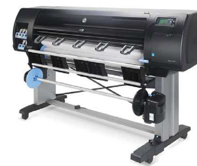
HP DesignJet Z6800 60" Production* Foto