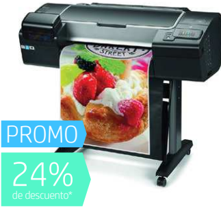
HP DesignJet Z2600 PS 24" (Ref.: T0B52A)

Impresoras gráficas con máximo impacto visual