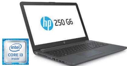
HP 250 G6 (Ref.: 1TT45EA)