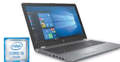
HP 250 G6 (Ref.: 1WY63EA)