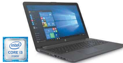
HP 250 G6 (Ref.: 1WZ03EA)