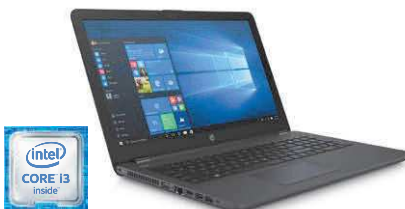
HP 250 G6 (Ref.: 1WZ03EA)