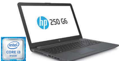
HP 250 G6 (Ref.: 1TT45EA)