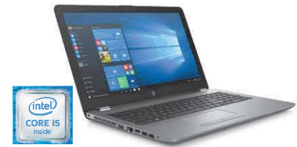
HP 250 G6 (Ref.: 1WY63EA)