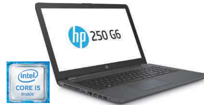
HP 250 G6 (Ref.: 1WY16EA)