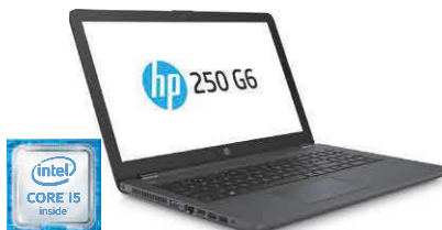
HP 250 G6 (Ref.: 1WY16EA)